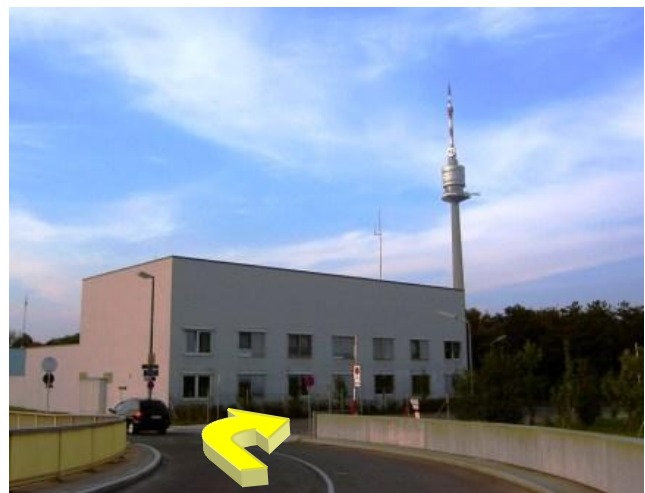
Bild 4 – rechts in die Wallenberggasse einbiegen